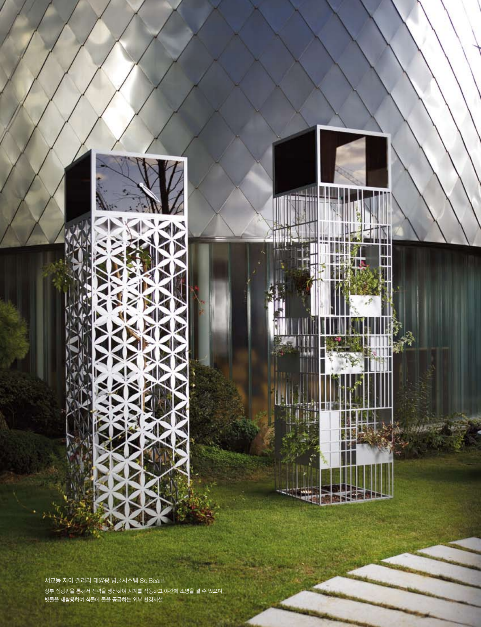
서교동 자이 갤러리 태양광 냉열시스템 SolBeam 상부 집광판을 통해서 전력을 생산하여 시계를 작동하고 야간에 조명을 켤 수 있으며, 빛물을 재활용하여 식물에 물을 공급하는 외부 환경시설