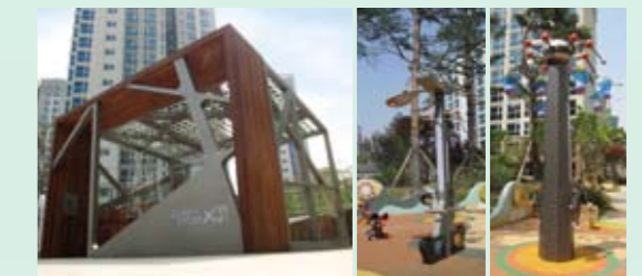
Human Energy 놀이시설물